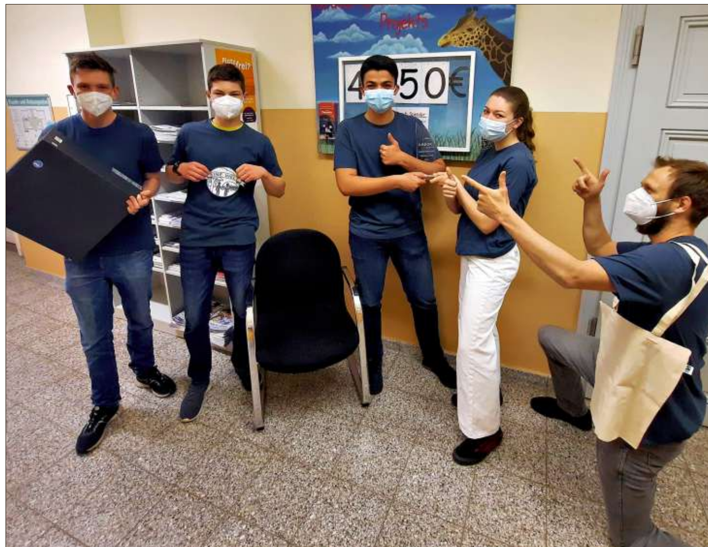
Die Schülerfirma des Roland-Gymnasiums hat den Landeswettbewerb gewonnen. In knapp zwei Wochen steht der Bundeswettbewerb an.

Dann entwickelten die Firmengründer nicht nur ein, sondern gleich zwei Konzepte. Zunächst wurde auf Instagram ein Second-Hand-Shop eröffnet. Auf dem bislang gymnasiumsinternen Flohmarkt können alte Sachen verkauft werden. Im Sinne der Nachhaltigkeit ist das auch die Möglich-